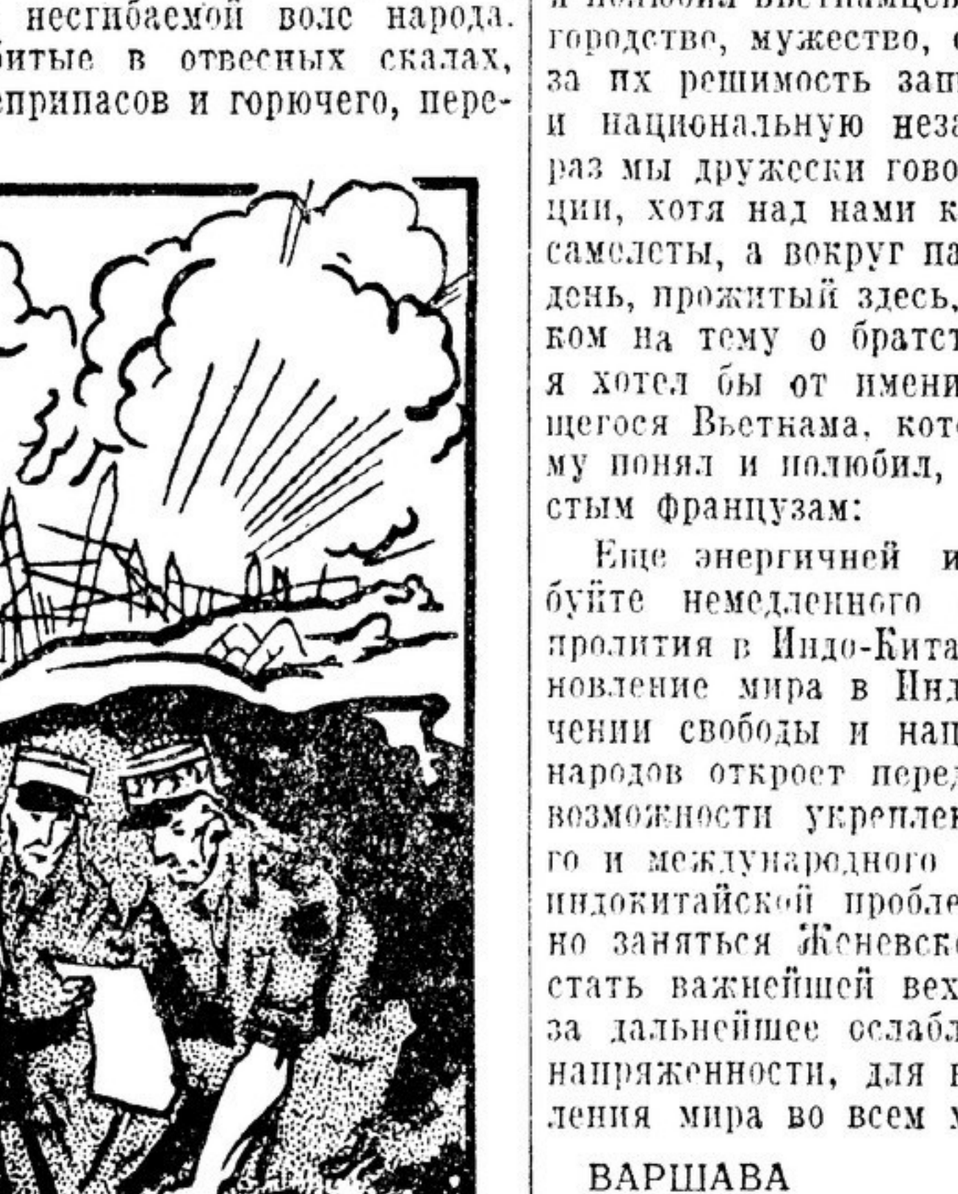
Во Вьетнаме. Один француз другому: «Боже мой, теперь все пропало, американцы собираются нам помочь!» Рисунок из австрийской газеты «Эстеррейхер фольксцейтунг»